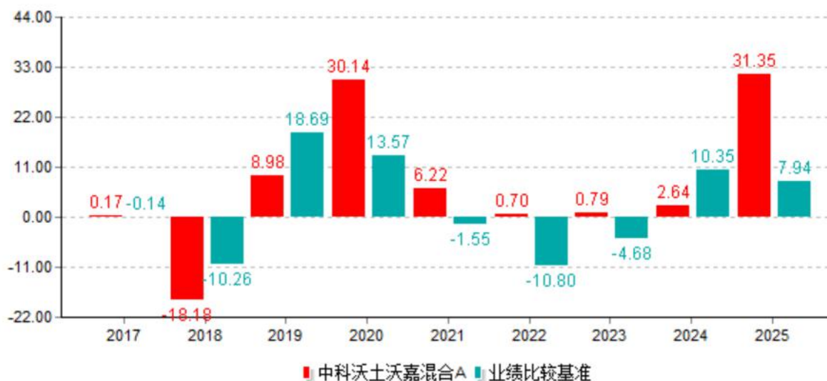
基金的过往业绩不代表未来表现；数据截止日：2025年12月31日 单位%