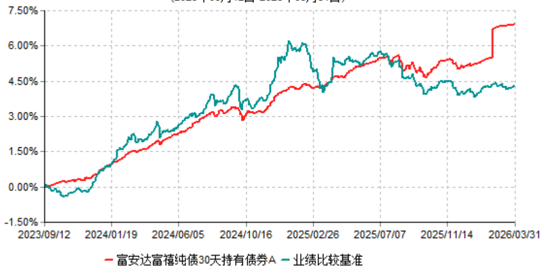
富安达富禧纯债30天持有债券A累计净值增长率与业绩比较基准收益率历史走势对比图 (2023年09月12日-2026年03月31日)