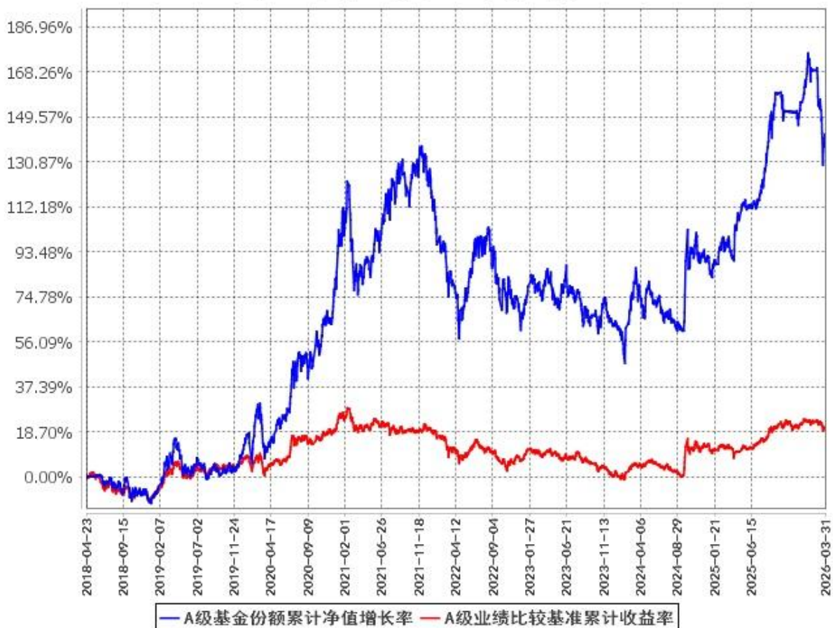
A级基金份额累计净值增长率与同期业绩比较基准收益率的历史走势对比图 (2018年4月23日至2026年3月31日)