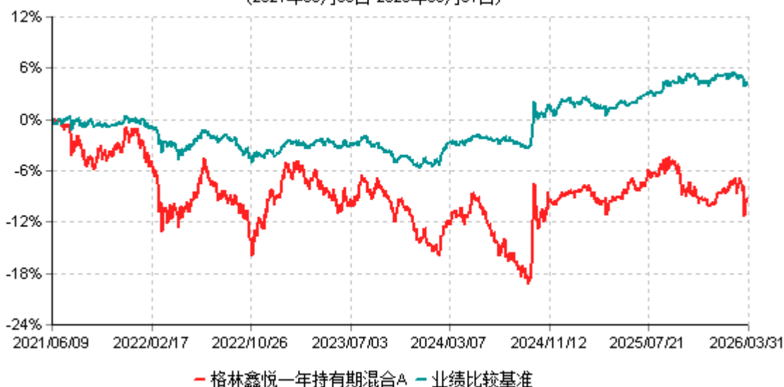
格林鑫悦一年持有期混合A累计净值增长率与业绩比较基准收益率历史走势对比图 (2021年06月09日-2026年03月31日)