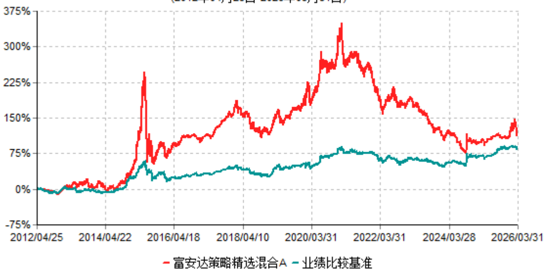
富安达策略精选混合A累计净值增长率与业绩比较基准收益率历史走势对比图 (2012年04月25日-2026年03月31日)