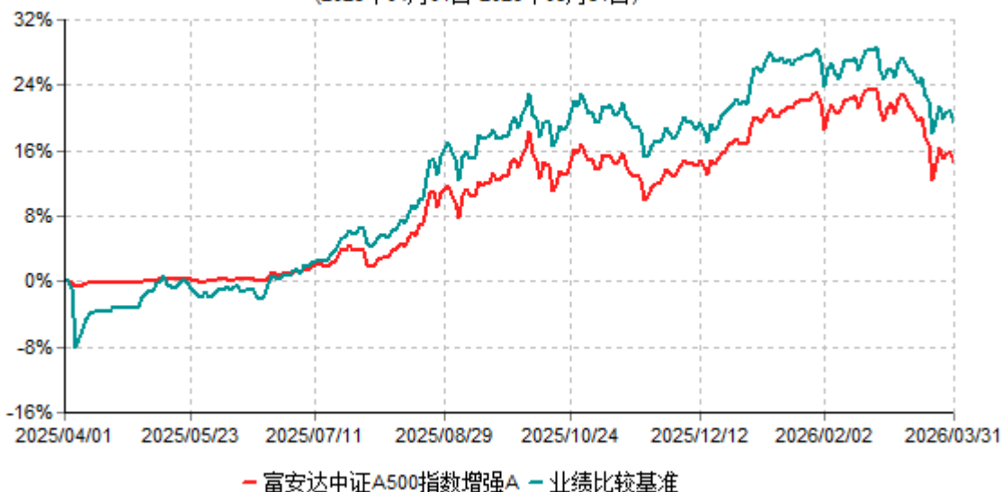
富安达中证A500指数增强A累计净值增长率与业绩比较基准收益率历史走势对比图 (2025年04月01日-2026年03月31日)