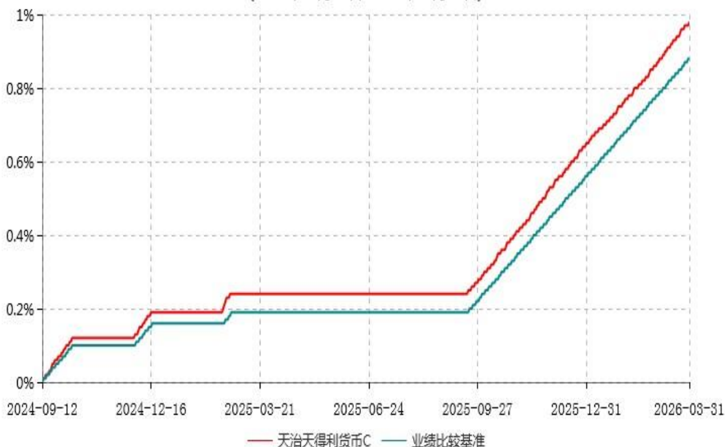
天治天得利货币C累计净值收益率与业绩比较基准收益率历史走势对比图 (2024年09月12日-2026年03月31日)

注：本基金自2024年9月10日起新增C类基金份额。2024年9月10日至2024年9月11日、2024年10月10日至2024年12月1日、2024年12月18日至2025年2月16日、2025年2月25日至2025年9月17日该类基金份额为零，对应区间累计净值收益率及业绩比较基准不变。