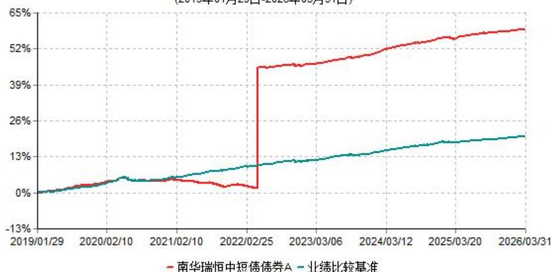
南华瑞恒中短债债券A累计净值增长率与业绩比较基准收益率历史走势对比图 (2019年01月29日-2026年03月31日)