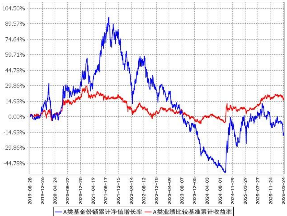
A类基金份额累计净值增长率与同期业绩比较基准收益率的历史走势对比图 (2019年8月28日至2026年3月31日)