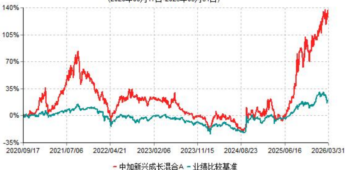
中加新兴成长混合A累计净值增长率与业绩比较基准收益率历史走势对比图 (2020年09月17日-2026年03月31日)