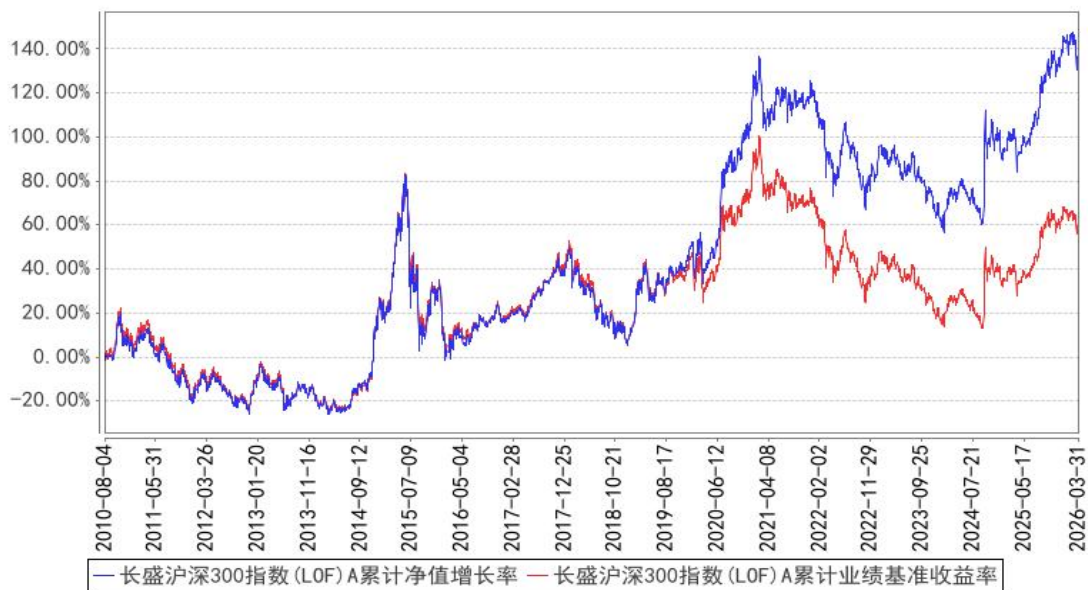
长盛沪深300指数(LOF)A累计净值增长率与同期业绩比较基准收益率的历史走势对比图