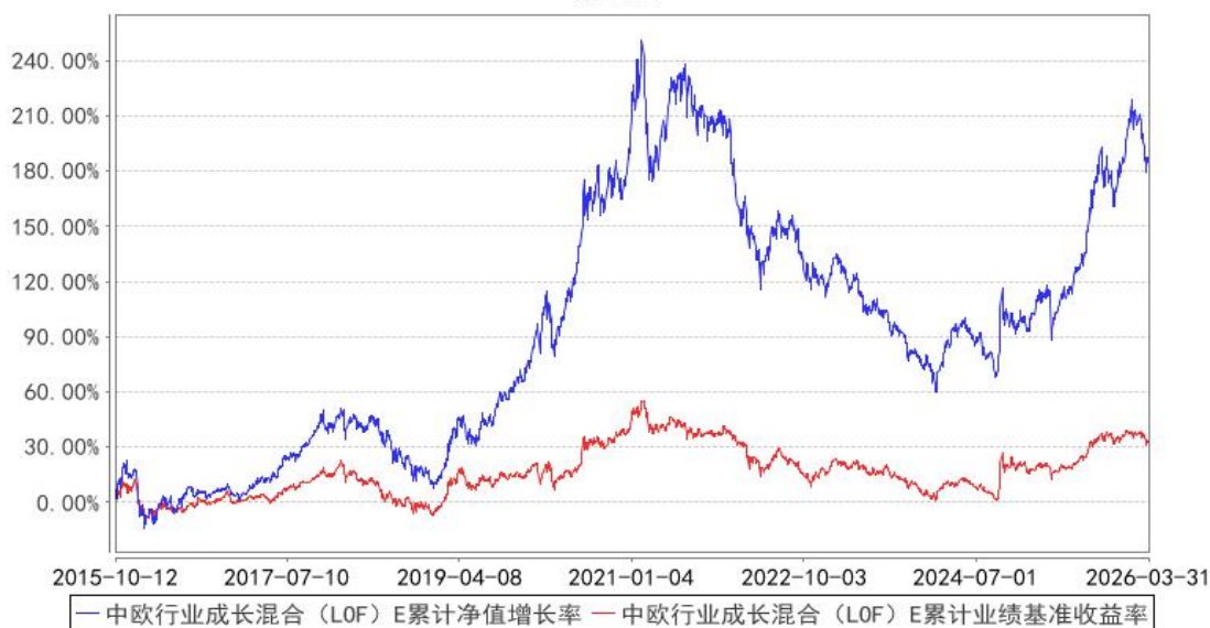
中欧行业成长混合 (LOF) E 累计净值增长率与同期业绩比较基准收益率的历史走势对比图

注：本基金自 2015 年 10 月 8 日新增 E 类份额，图示日期为 2015 年 10 月 12 日至 2026 年 03 月 31 日。