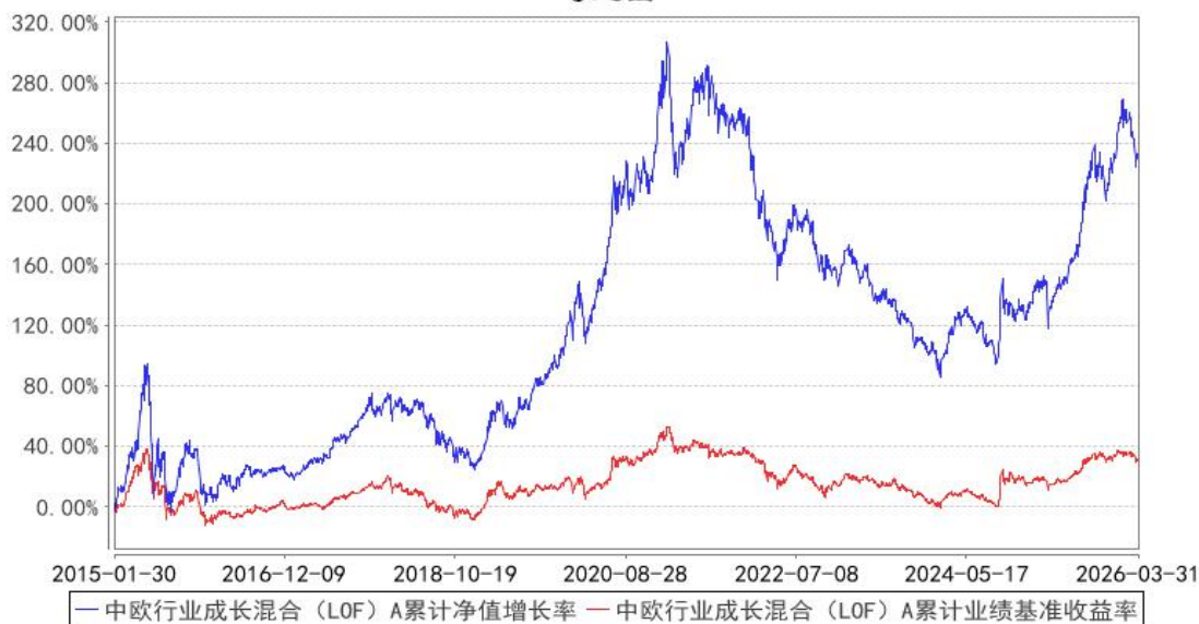
中欧行业成长混合 (LOF) A 累计净值增长率与同期业绩比较基准收益率的历史走势对比图