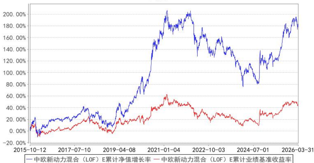
中欧新动力混合（LOF）E 累计净值增长率与同期业绩比较基准收益率的历史走势对比图

注：自 2015 年 10 月 8 日起，本基金增加 E 类份额。图示日期为 2015 年 10 月 12 日至 2026 年 03 月 31 日。