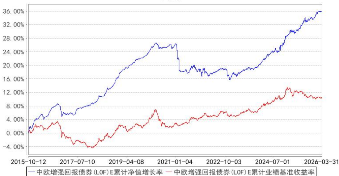
中欧增强回报债券（LOF）E 累计净值增长率与同期业绩比较基准收益率的历史走势对比图

注：本基金于 2015 年 10 月 8 日新增 E 份额，图示日期为 2015 年 10 月 12 日至 2026 年 03 月 31 日。