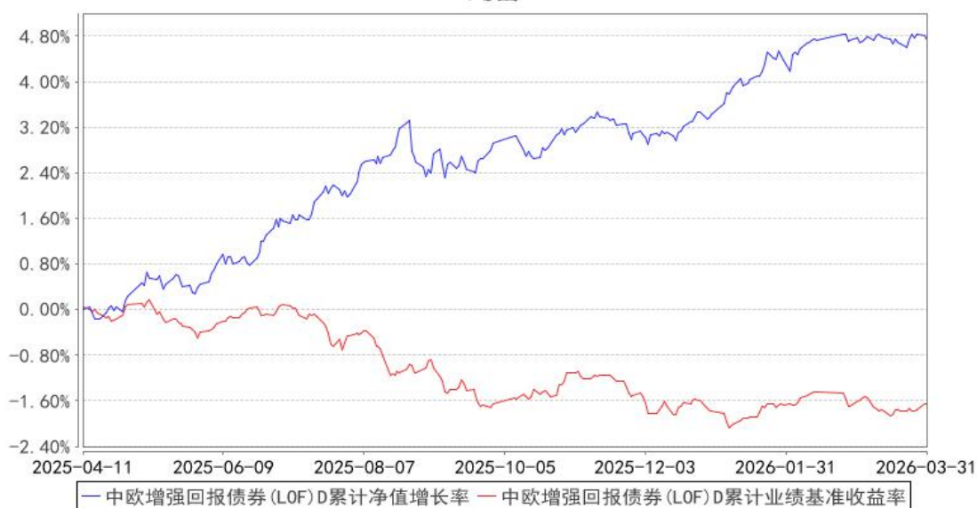
中欧增强回报债券 (LOF) D 累计净值增长率与同期业绩比较基准收益率的历史走势对比图

注：本基金于 2025 年 3 月 26 日新增 D 类份额，图示日期为 2025 年 4 月 11 日至 2026 年 03 月 31 日。