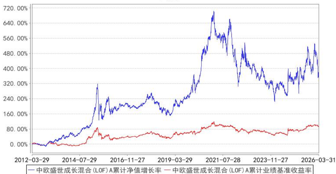
中欧盛世成长混合 (LOF) A 累计净值增长率与同期业绩比较基准收益率的历史走势对比图