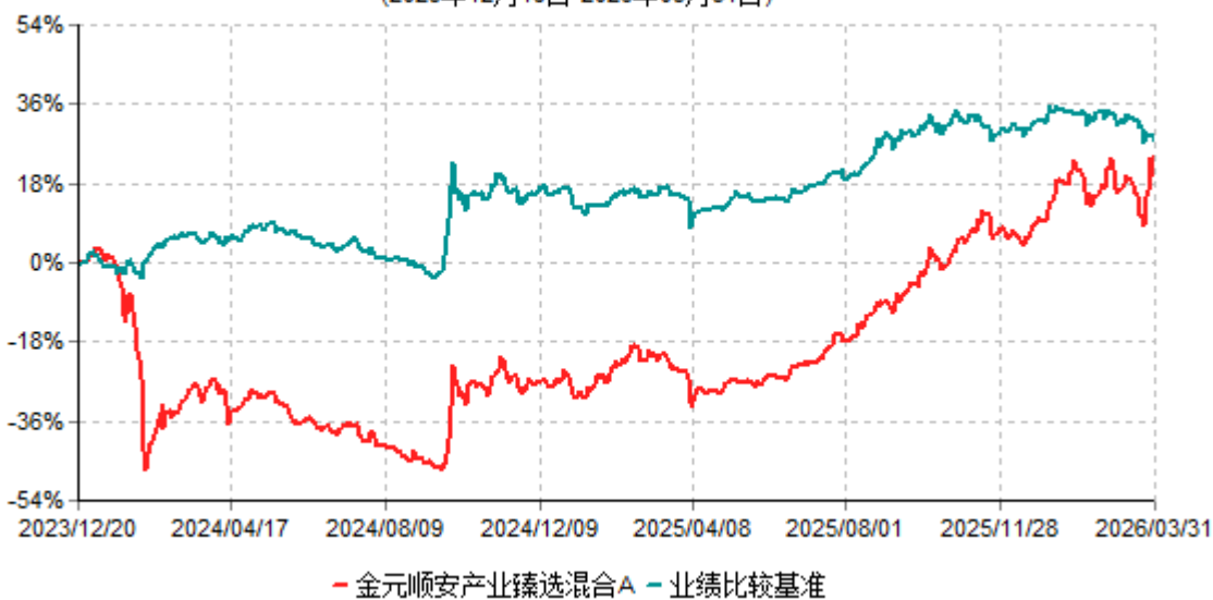
金元顺安产业臻选混合A累计净值增长率与业绩比较基准收益率历史走势对比图 (2023年12月19日-2026年03月31日)