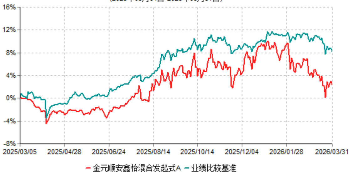
金元顺安鑫怡混合发起式A累计净值增长率与业绩比较基准收益率历史走势对比图 (2025年03月04日-2026年03月31日)