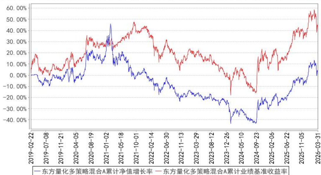
东方量化多策略混合A累计净值增长率与同期业绩比较基准收益率的历史走势对比图