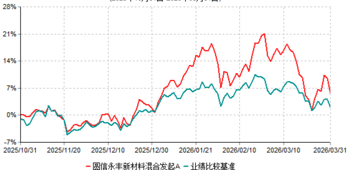
圆信永丰新材料混合发起A累计净值增长率与业绩比较基准收益率历史走势对比图 (2025年10月31日-2026年03月31日)