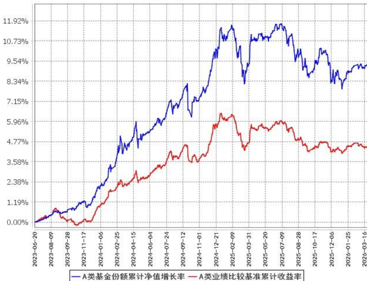
A类基金份额累计净值增长率与同期业绩比较基准收益率的历史走势对比图 (2023年6月20日至2026年3月31日)