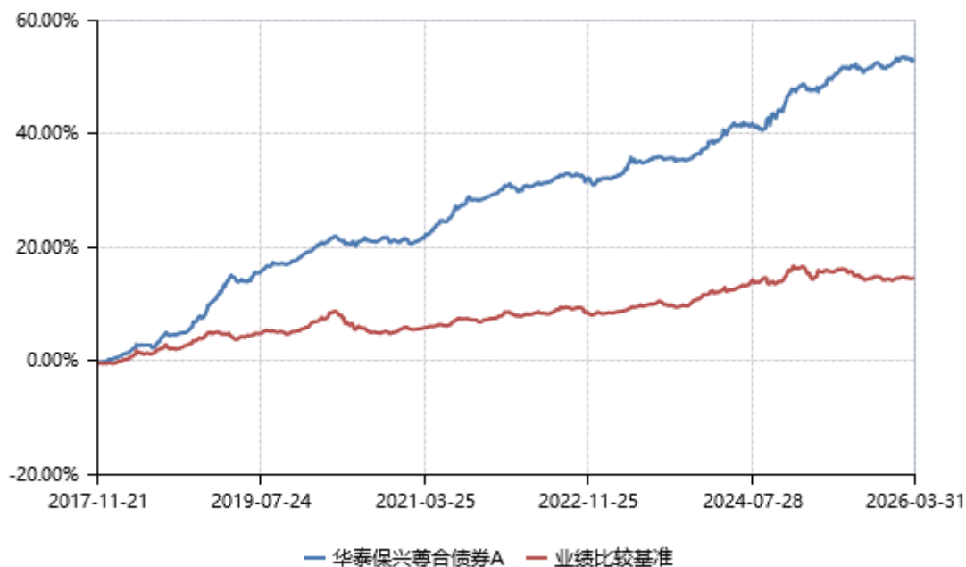
华泰保兴尊合债券 A