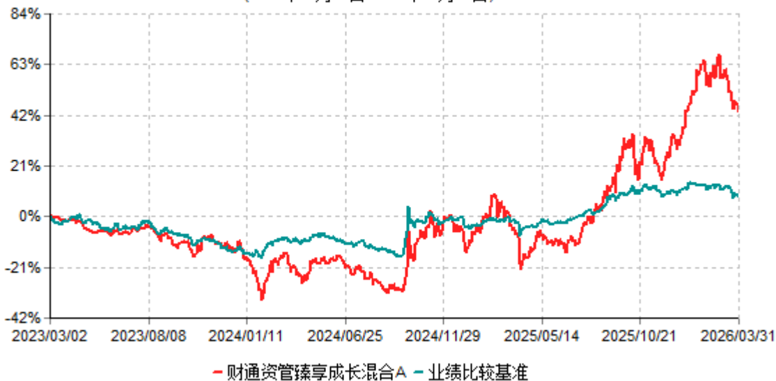
财通资管臻享成长混合A累计净值增长率与业绩比较基准收益率历史走势对比图 (2023年03月02日-2026年03月31日)