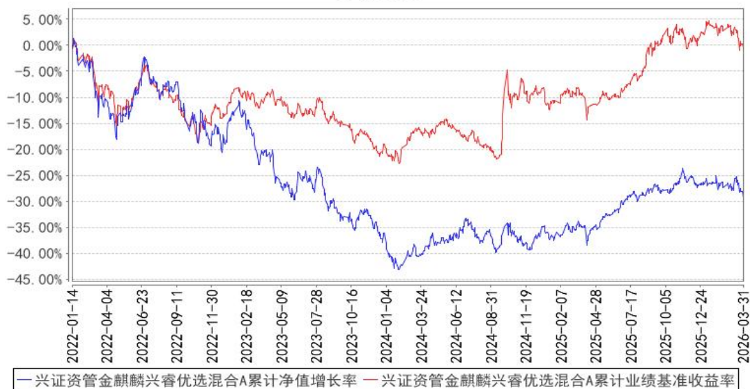
兴证资管金麒麟兴睿优选混合A累计净值增长率与同期业绩比较基准收益率的历史走势对比图