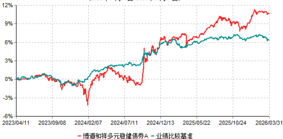
博道和祥多元稳健债券A累计净值增长率与业绩比较基准收益率历史走势对比图 (2023年04月11日-2026年03月31日)

注：本基金建仓期为自基金合同生效日起的6个月。截至建仓期结束，本基金各项资产配置比例符合基金合同及招募说明书有关投资比例的约定。