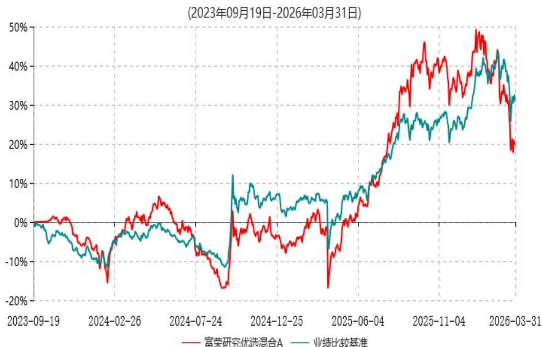
富荣研究优选混合A累计净值增长率与业绩比较基准收益率历史走势对比图