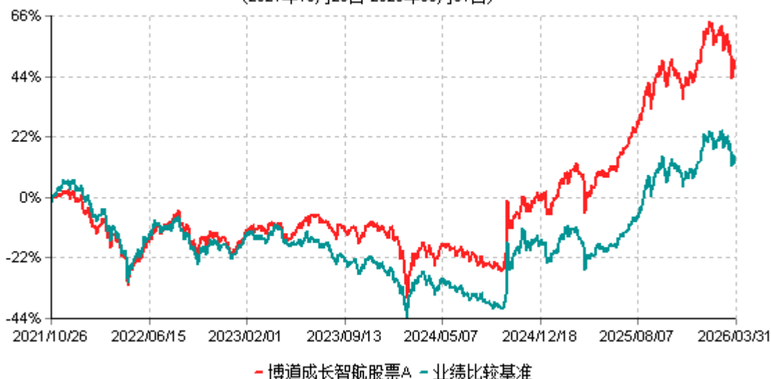
博道成长智航股票A累计净值增长率与业绩比较基准收益率历史走势对比图 (2021年10月26日-2026年03月31日)

注：本基金建仓期为自基金合同生效日起的6个月。截至建仓期结束，本基金各项资产配置比例符合基金合同及招募说明书有关投资比例的约定。