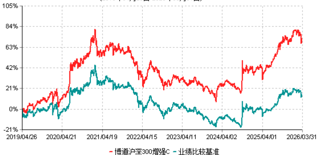
博道沪深300增强C累计净值增长率与业绩比较基准收益率历史走势对比图 (2019年04月26日-2026年03月31日)

注：本基金建仓期为自基金合同生效日起的6个月。截至建仓期结束，本基金各项资产配置比例符合基金合同及招募说明书有关投资比例的约定。