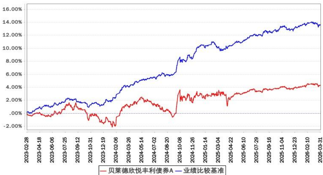
贝莱德欣悦丰利债券A累计净值增长率与同期业绩比较基准收益率的历史走势对比图