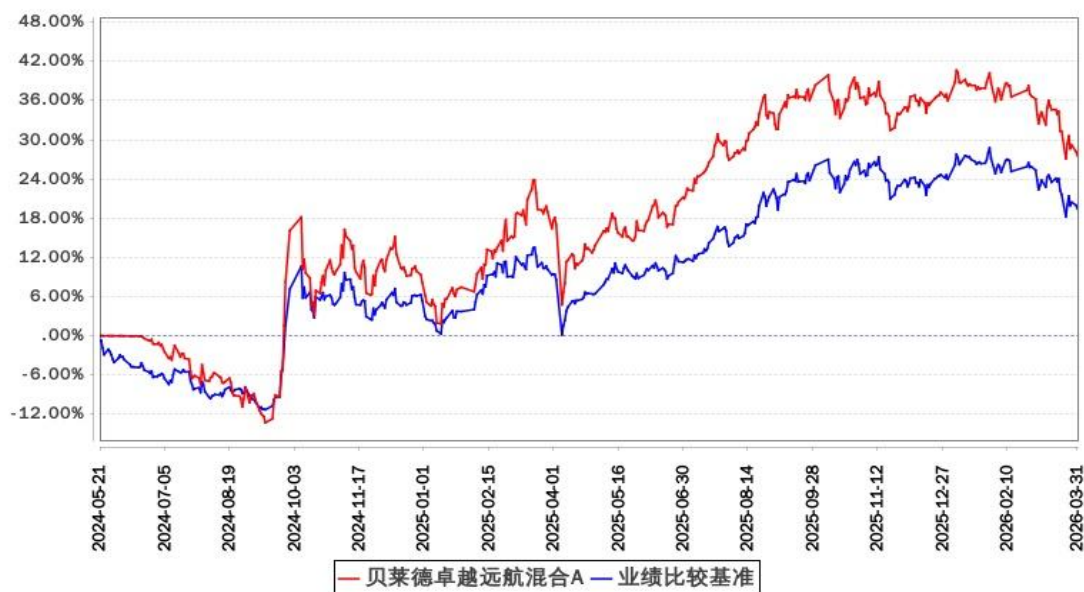
贝莱德卓越远航混合A累计净值增长率与同期业绩比较基准收益率的历史走势对比图