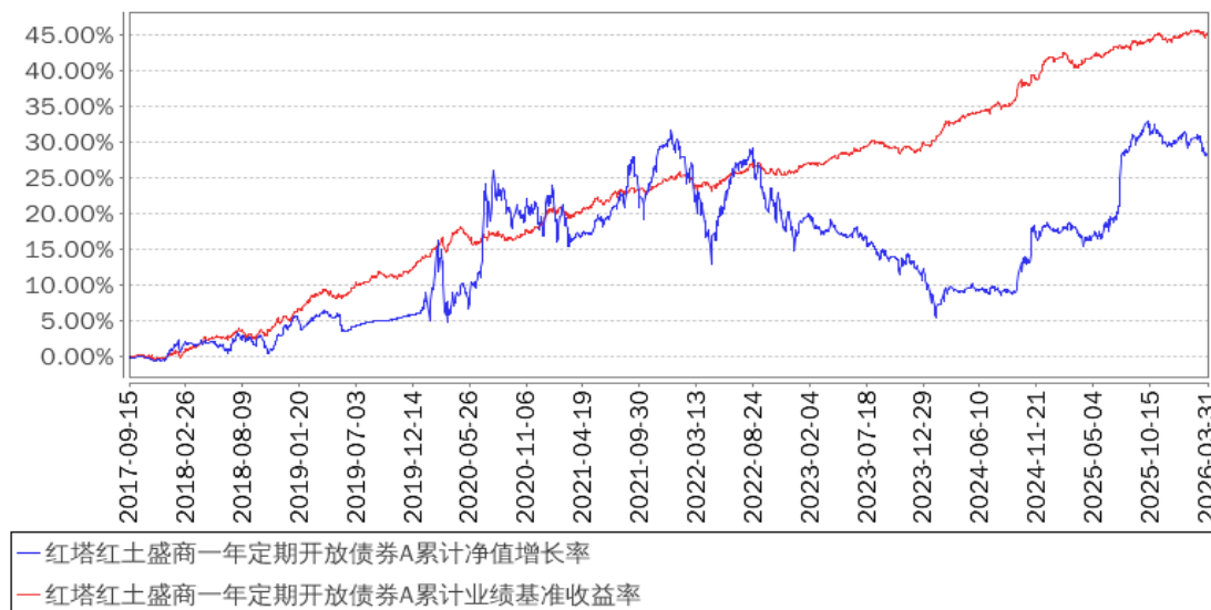
红塔红土盛商一年定期开放债券A累计净值增长率与同期业绩比较基准收益率的历史走势对比图