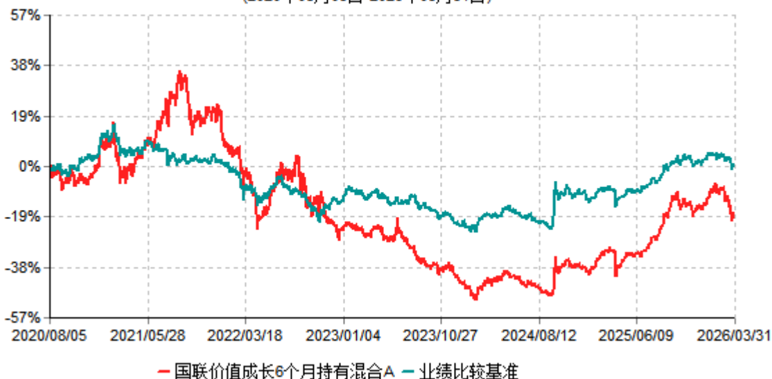
国联价值成长6个月持有混合A累计净值增长率与业绩比较基准收益率历史走势对比图 (2020年08月05日-2026年03月31日)