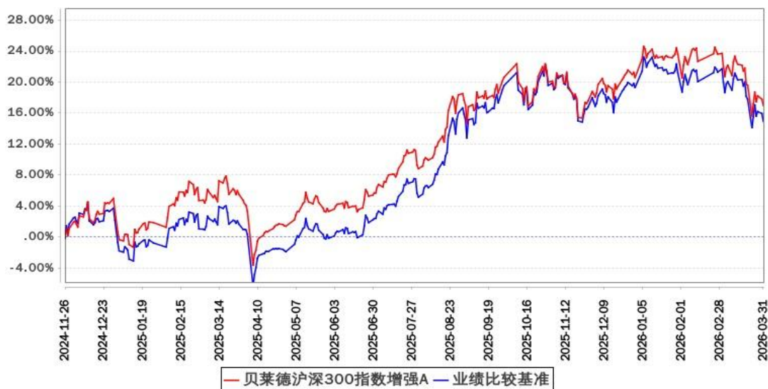
贝莱德沪深300指数增强A累计净值增长率与同期业绩比较基准收益率的历史走势对比图