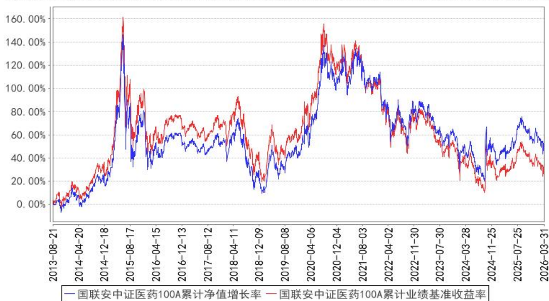
国联安中证医药100A累计净值增长率与同期业绩比较基准收益率的历史走势对比图

注：1、国联安中证医药 100 指数证券投资基金于 2018 年 10 月 26 日起增加收取销售服务费的 C 类基金份额，并对本基金基金合同作相应修改，原有的基金份额在开放申购赎回后，全部转换为国联安中证医药 100 指数 A 类份额；