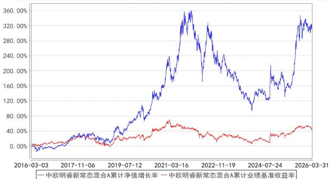
中欧明睿新常态混合A累计净值增长率与同期业绩比较基准收益率的历史走势对比图

注：2021年9月8日起组合业绩比较基准变更为沪深300指数收益率*60%+中证港股通综合指数(人民币)收益率*20%+中债综合指数收益率*20%。