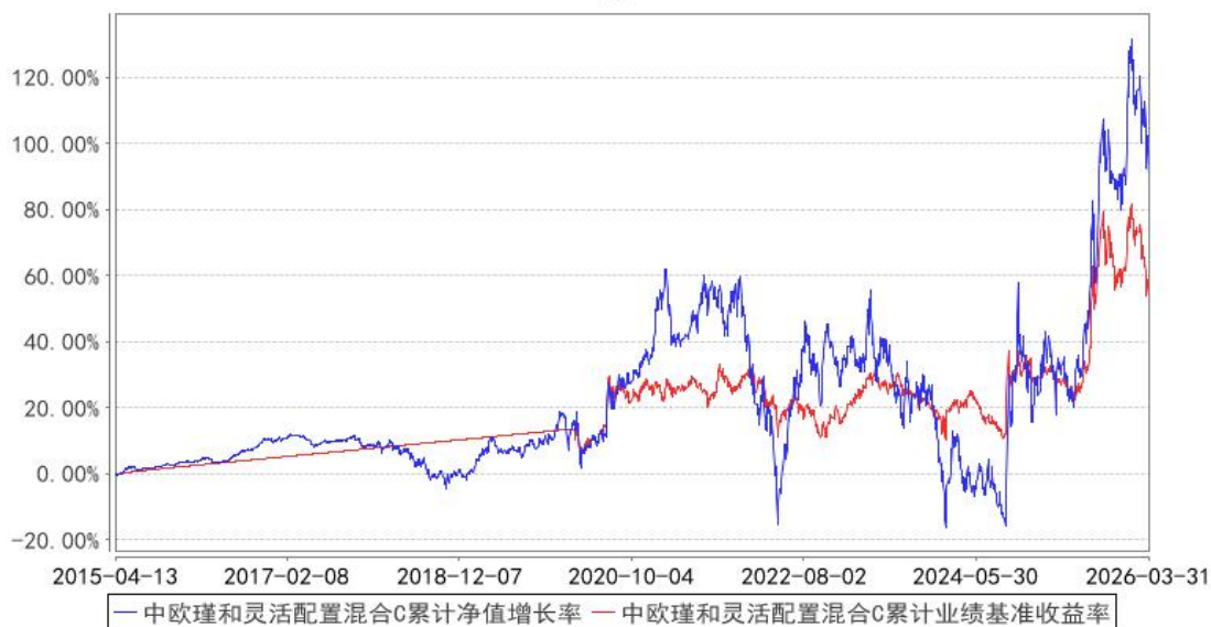
中欧瑾和灵活配置混合C累计净值增长率与同期业绩比较基准收益率的历史走势对比图

注：2025 年 4 月 17 日起组合业绩比较基准由中证 800 行业中性低波动指数收益率*80%+中证短债指数收益率*20%变更为上证科创板 50 成份指数收益率*80%+银行活期存款利率(税后)*20%。