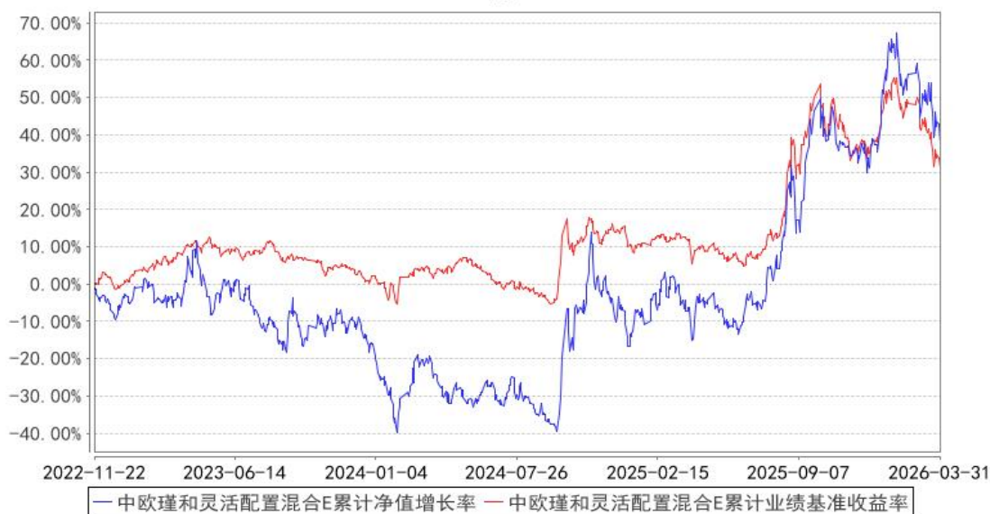
中欧瑾和灵活配置混合E累计净值增长率与同期业绩比较基准收益率的历史走势对比图

注：本基金于 2022 年 11 月 21 日新增 E 类份额，图示日期为 2022 年 11 月 22 日至 2026 年 03 月 31 日。