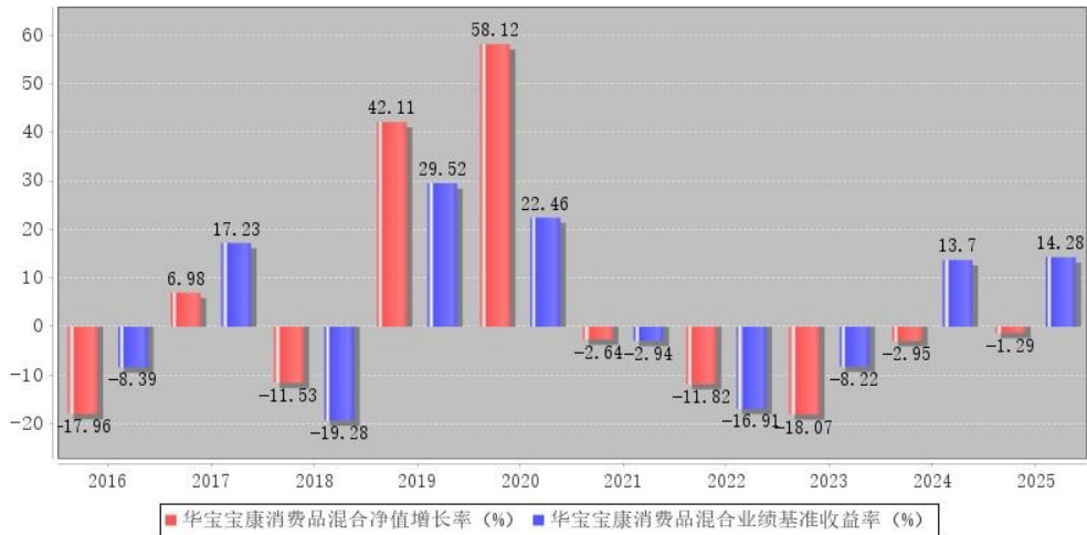
华宝宝康消费品混合每年净值增长率与同期业绩比较基准收益率的对比图