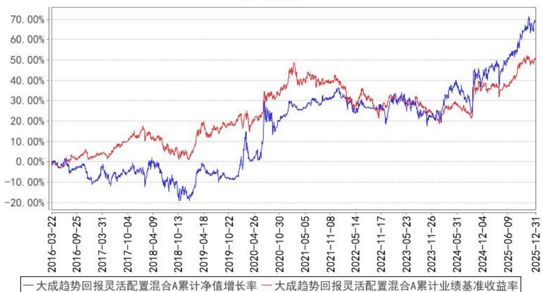
大成趋势回报灵活配置混合A累计净值增长率与同期业绩比较基准收益率的历史走势对比图

(二) 自基金合同生效以来基金份额累计净值增长率变动及其与同期业绩比较基准收益率变动的比较