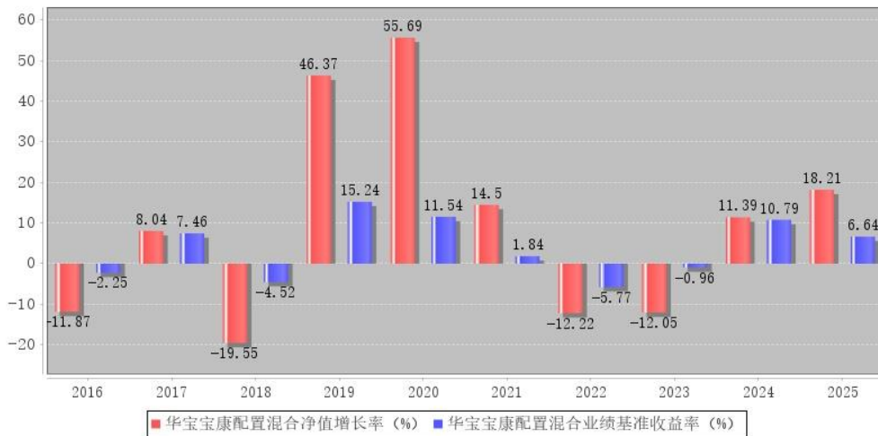
华宝宝康配置混合每年净值增长率与同期业绩比较基准收益率的对比图