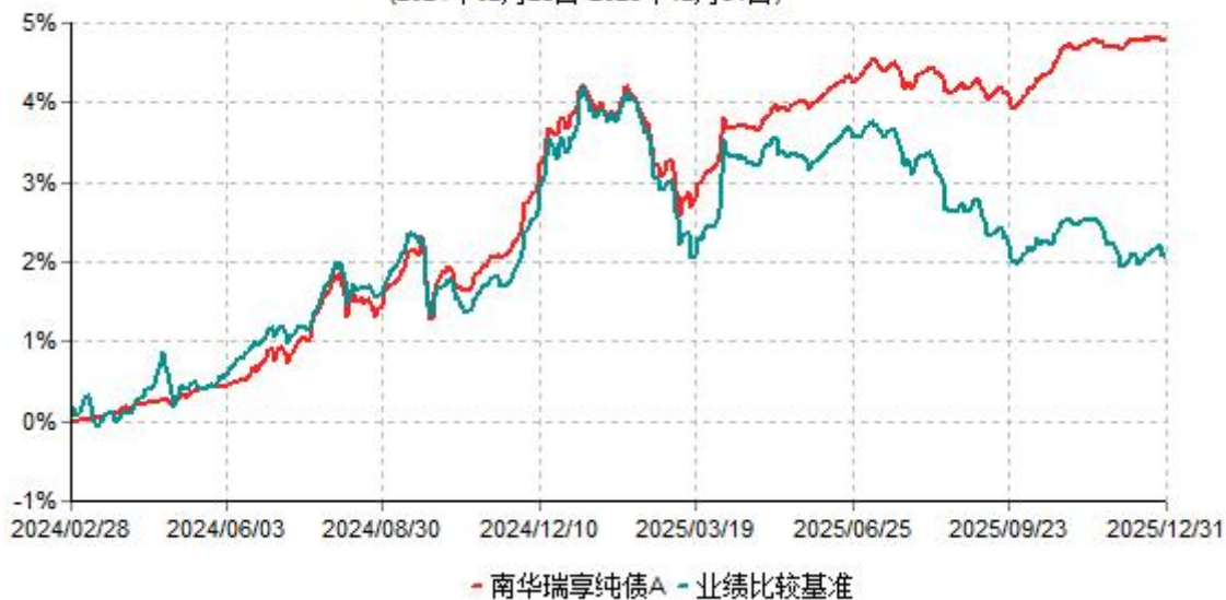
南华瑞享纯债A累计净值增长率与业绩比较基准收益率历史走势对比图 (2024年02月28日-2025年12月31日)

(2)南华瑞享纯债C基金份额累计净值增长率与业绩比较基准收益率的历史走势对比图（2024年2月28日至2025年12月31日）