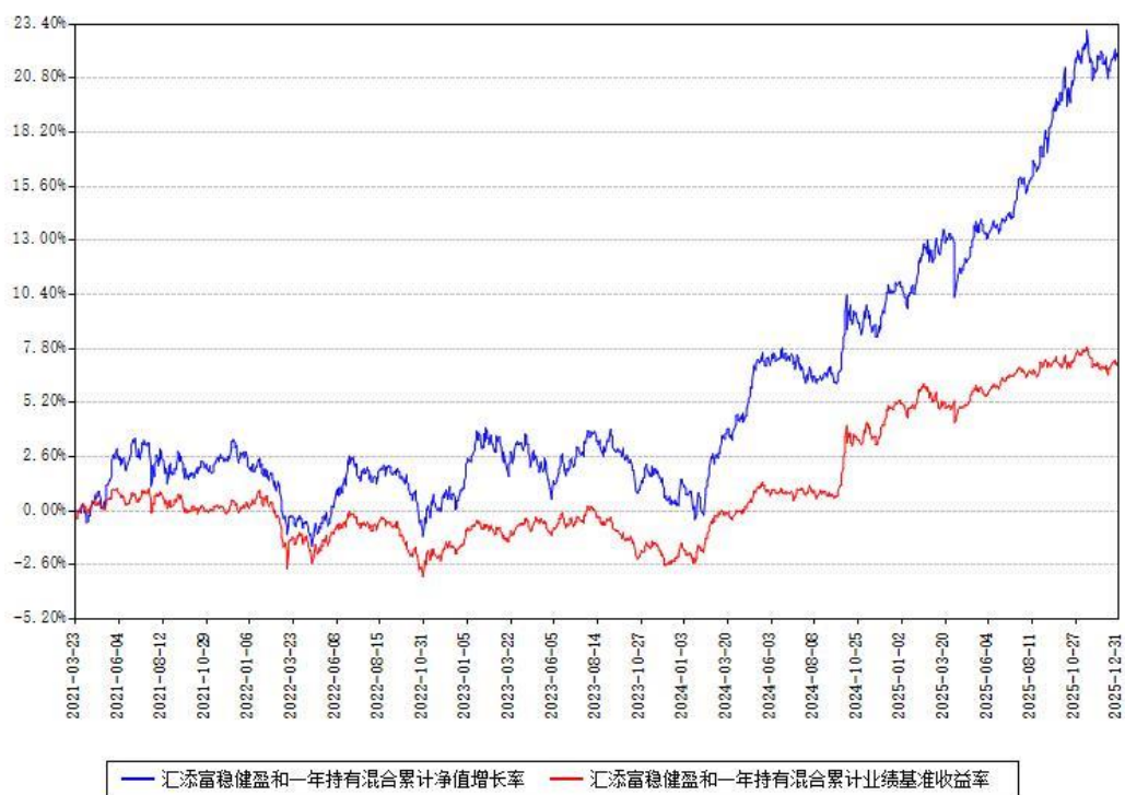
汇添富稳健盈和一年持有混合累计净值增长率与同期业绩基准收益率对比图