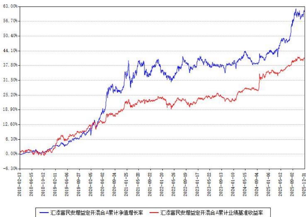
汇添富民安增益定开混合A累计净值增长率与同期业绩基准收益率对比图

(二)自基金合同生效以来基金累计净值增长率变动及其与同期业绩比较基准收益率变动的比较图