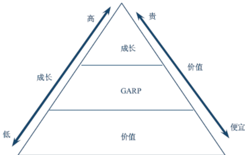
图 1 GARP 投资理念

② 对价值型公司的成长属性进行分析，可以发现相对投资价值较具成长性的股票，在成长潜力释放的过程中获得收益，规避市场价格未合理反映其成长性不足的股票。