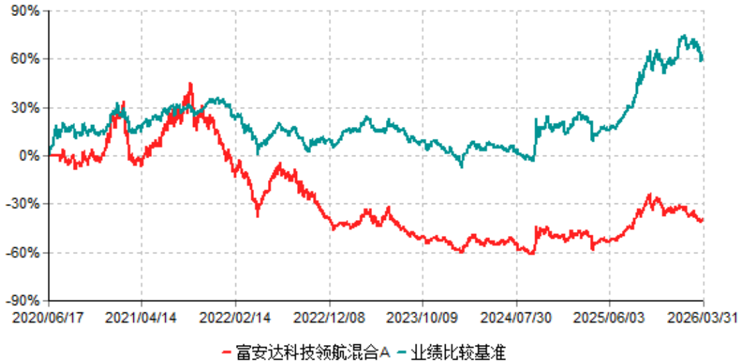
富安达科技领航混合A累计净值增长率与业绩比较基准收益率历史走势对比图 (2020年06月17日-2026年03月31日)