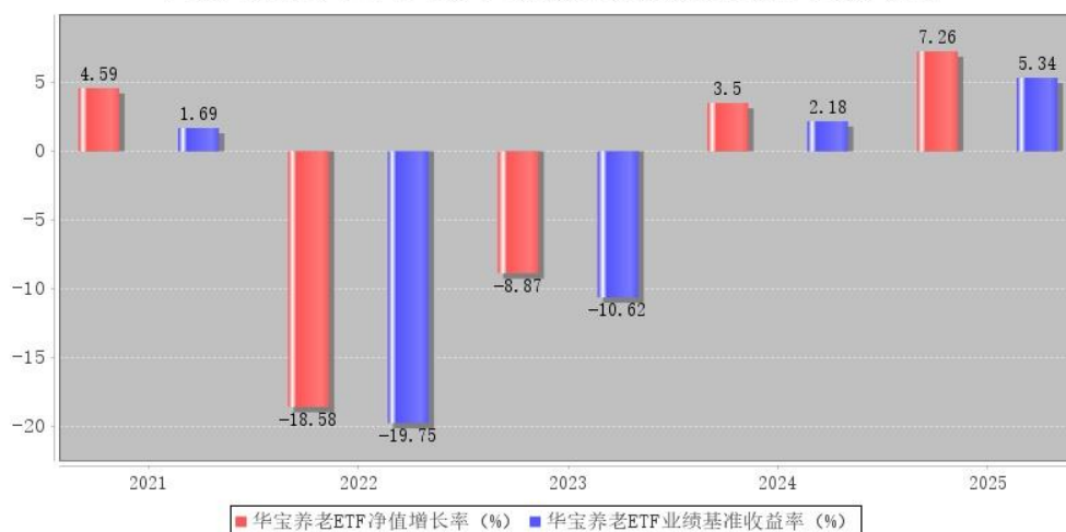
华宝养老ETF每年净值增长率与同期业绩比较基准收益率的对比图