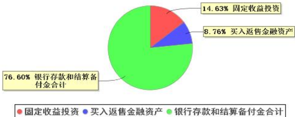
投资组合资产配置图表 (2025年9月30日)