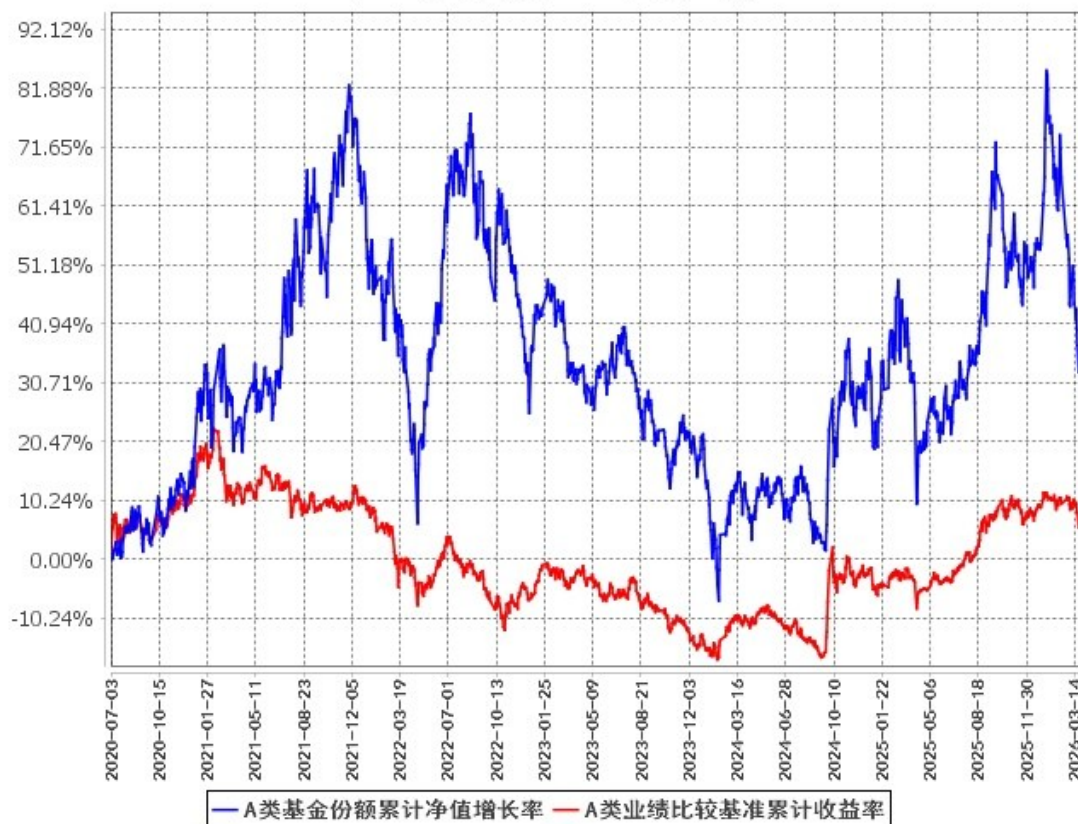
A类基金份额累计净值增长率与同期业绩比较基准收益率的历史走势对比图 (2020年7月3日至2026年3月31日)