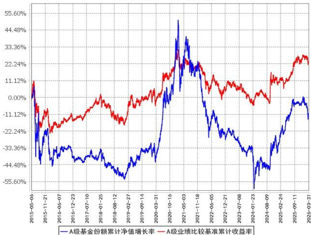
A级基金份额累计净值增长率与同期业绩比较基准收益率的历史走势对比图 (2015年5月6日至2026年3月31日)