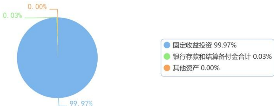
投资组合资产配置图表（数据截至日期：2026年03月31日）