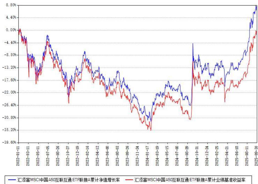
汇添富MSCI中国A50互联互通ETF联接A累计净值增长率与同期业绩基准收益率对比图