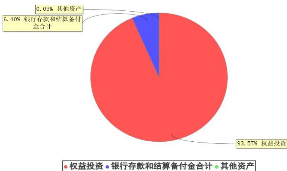
投资组合资产配置图表(2026年3月31日)